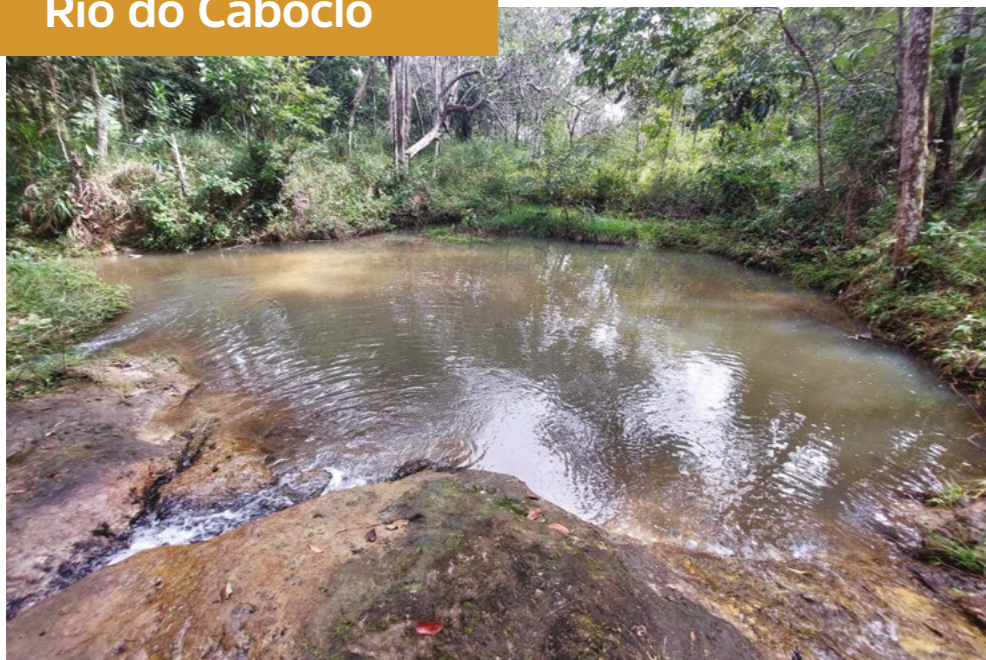
FIGURA 11: Rio da Meladinha

“Lembro que meu avô dizia que na área do rio do Caboclo tinha os objetos de fazer azeite, o rodão e a olaria onde fabricavam tijolos. Lá viviam muitas pessoas negras. Ainda hoje é possível ver o resto de telha, de tijolo e o resto do rodão. A comunidade ainda planta roça lá.”