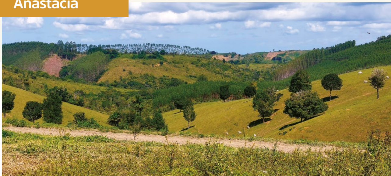
FIGURA 9: Anastácia, 2026

“[...] até cerca de duas décadas atrás predominavam matas fechadas nessas áreas, com muitos pés de dendê próximos às fontes de água, pés de andaiá (ou indaiá) e árvores diversas. Por ser um vale e por sua vegetação densa, a região era adequada para o esconderijo de escravos fugidos e para a formação do quilombo.” (Brasil, 2009, p. 57)