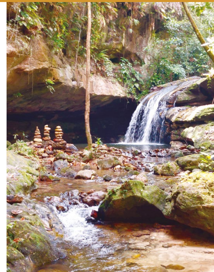
FIGURA 13: Poço da Sereia

“Era festa de muita gente. Começava a vir gente desde dezembro, e as vindas e presentes duravam até fevereiro. Era devoção, e lazer com respeito. Era bom. Era uma grande área de lazer. O Poço da Sereia ainda é um lugar bonito. Antigamente, todo mundo que ia pra lá ficava encantado. Vinha gente de todo lugar. Atualmente, a sereia não está mais lá. Cheguei a ir ao Poço da Sereia quando a tradição era viva, enquanto a sereia ainda estava lá. As pessoas sempre faziam as oferendas. Soubemos que ela não estava mais no local quando ela deixou de aparecer, quando os presentes pararam de ser recebidos. Quando ela quer o presente, ele não volta. Quando ela não quer, ele volta.”