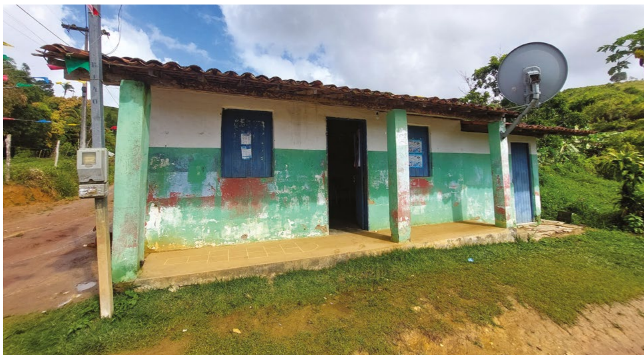
FIGURA 17: Escola do Garuçu, 2025

“Minha mãe sempre me conta das tentativas de se fechar a Escola Municipal Santo Antônio, que foi construída no ano 2000. [...] foi um espaço tão sonhado pelas dificuldades que ela passou na infância de estudar em longa distância, veio a ideia de construir a escola aqui na comunidade para ajudar a comunidade a estudar perto de casa [...]”