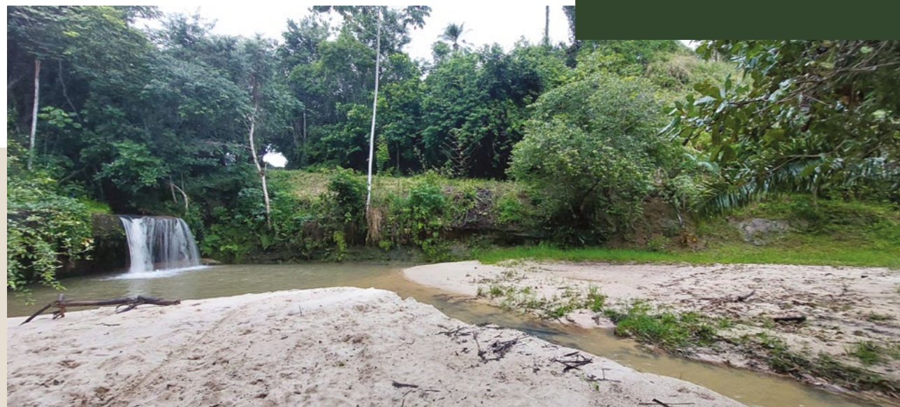
FIGURA 18: Eucalipto, 2025

“No lado da Mutamba não havia moradores. Eram todos na parte de baixo. Então Lauro e Aragão tiraram todo mundo dessa parte e colocou todo mundo para a beira da estrada. Ninguém morava ali antes. Aquela parte dali era só mata. As pessoas moravam onde hoje estão plantados os eucaliptos. Tiraram todo mundo dali e disseram, ‘vou te dar a terra’, e as pessoas perderam as plantações, as roças, perderam árvores frutíferas. Perderam tudo! Só ganharam um pedaço de terra (beira de pista), para desocuparem o espaço para o plantio de eucalipto.”