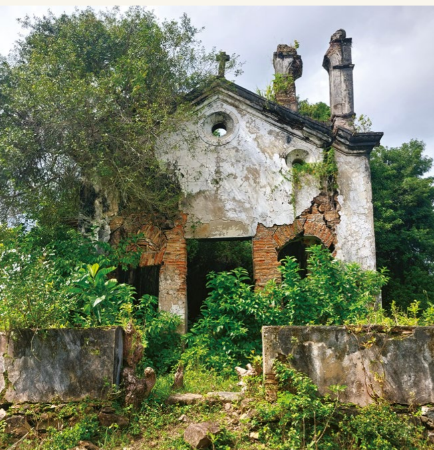
FIGURA 15: Ruínas da Igreja de Santo Antônio (Capanema)