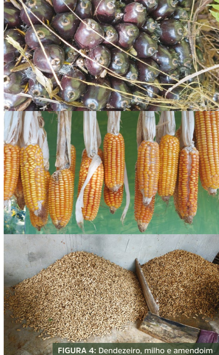
FIGURA 4: Dendezeiro, milho e amendoim

“Os quilombolas do Guai acreditam que a mariscagem sempre tenha ocorrido paralelamente ao trabalho nas lavouras, mesmo quando os negros ainda estavam submetidos ao regime escravocrata nos engenhos, muito deles ladeados por mangues, como no caso do Engenho de Capanema. A pesca e a mariscagem eram atividades complementares de subsistência que asseguravam a existência dos quilombos e por isso muitos moravam nas proximidades da maré. Para os quilombos, peixes e mariscos eram e ainda hoje são a base alimentar das comunidades.” (Brasil, 2009, p. 42-43)