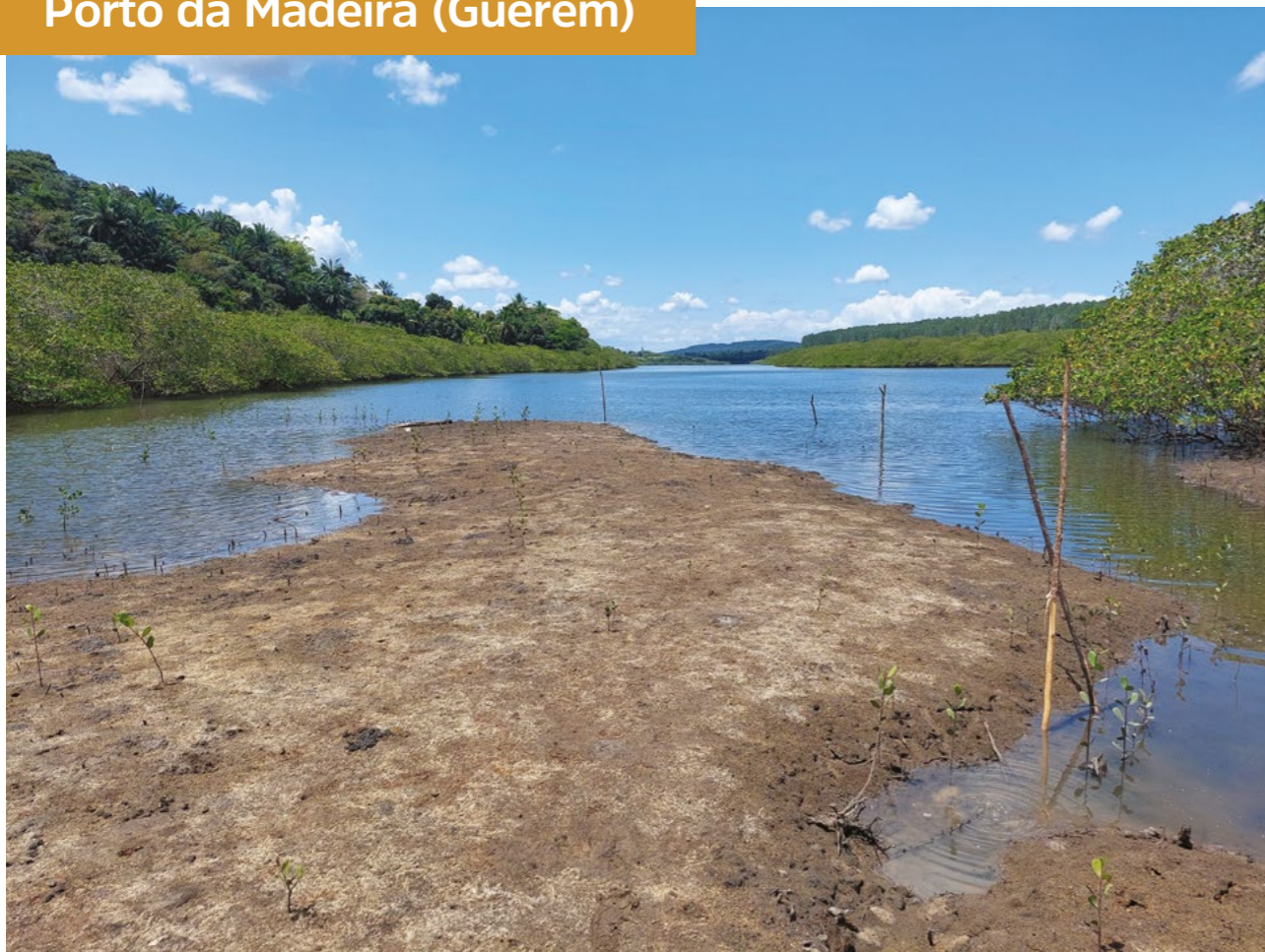
FIGURA 14: Porto do Guerém