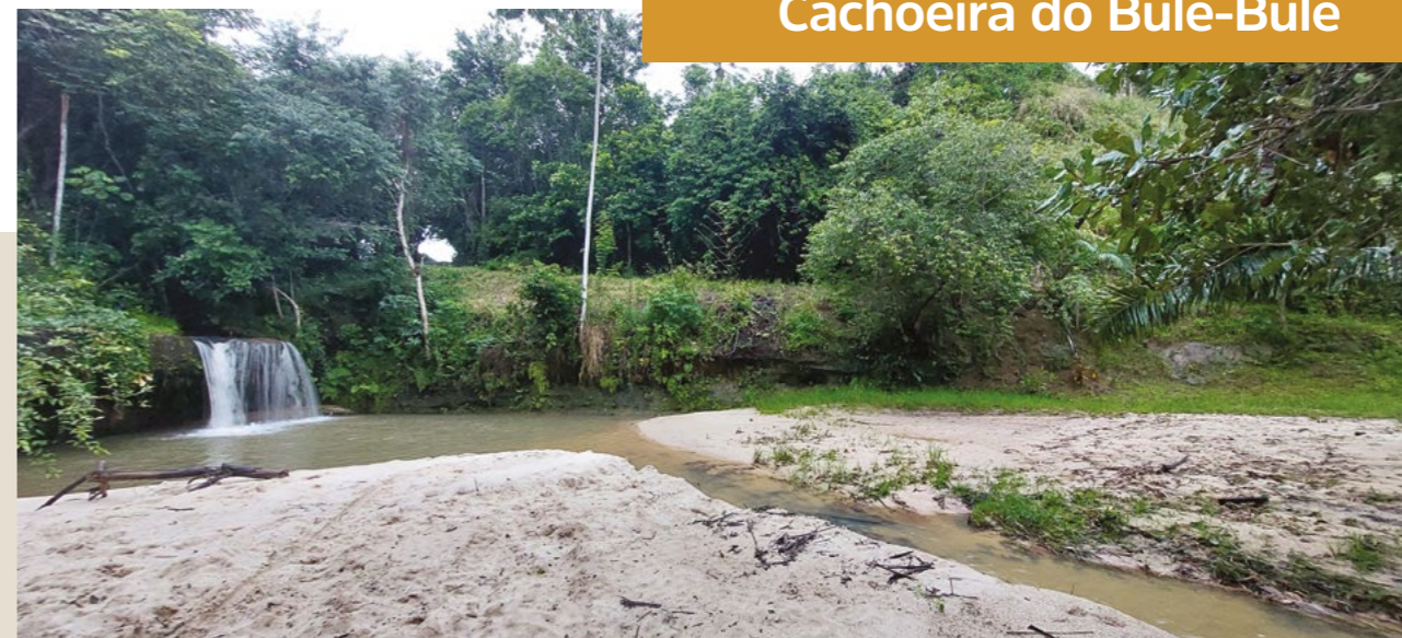
FIGURA 13: Cachoeira do Bule-Bule, ano

“No Bule-Bule, tem outra bonita cachoeira, mas o fazendeiro está colocando cachorros valentes, proibindo entrada e controlando entradas. ‘Falam que compraram o lugar’.”