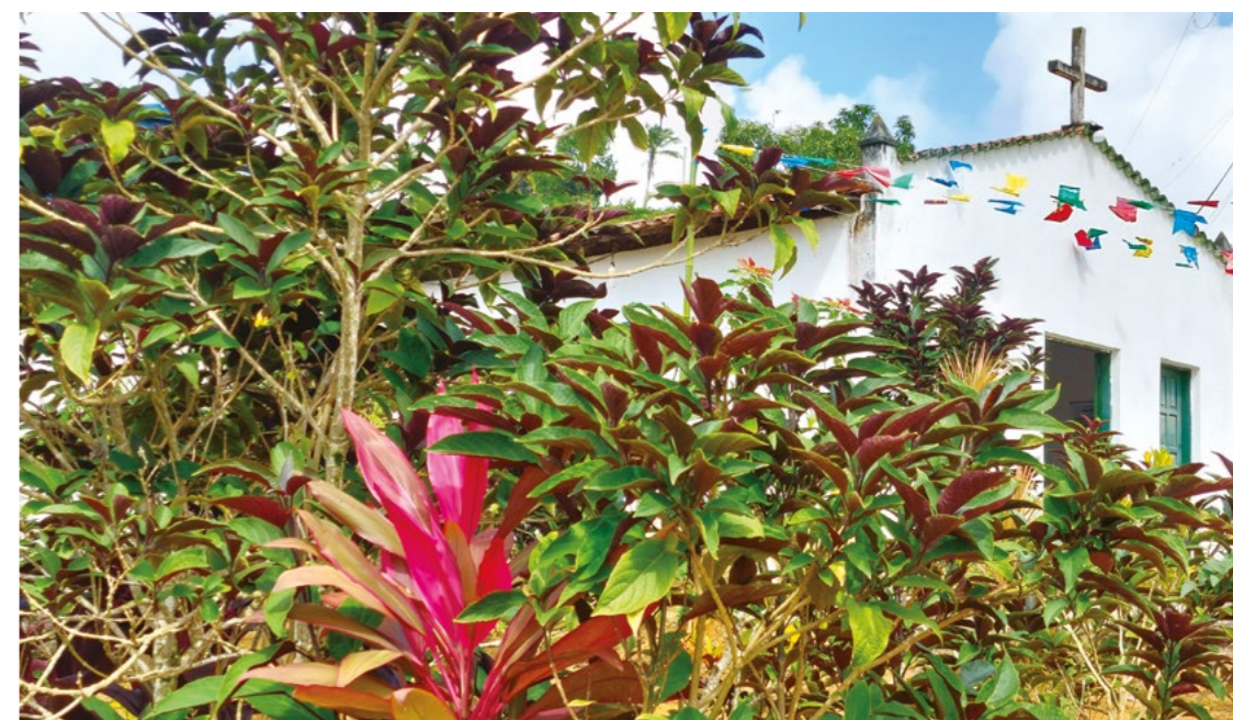
FIGURA 8: Foto Igreja Santo Antônio do Guaruçu

Everlane Neris Faleiro 21 anos, moradora do Guaruçu