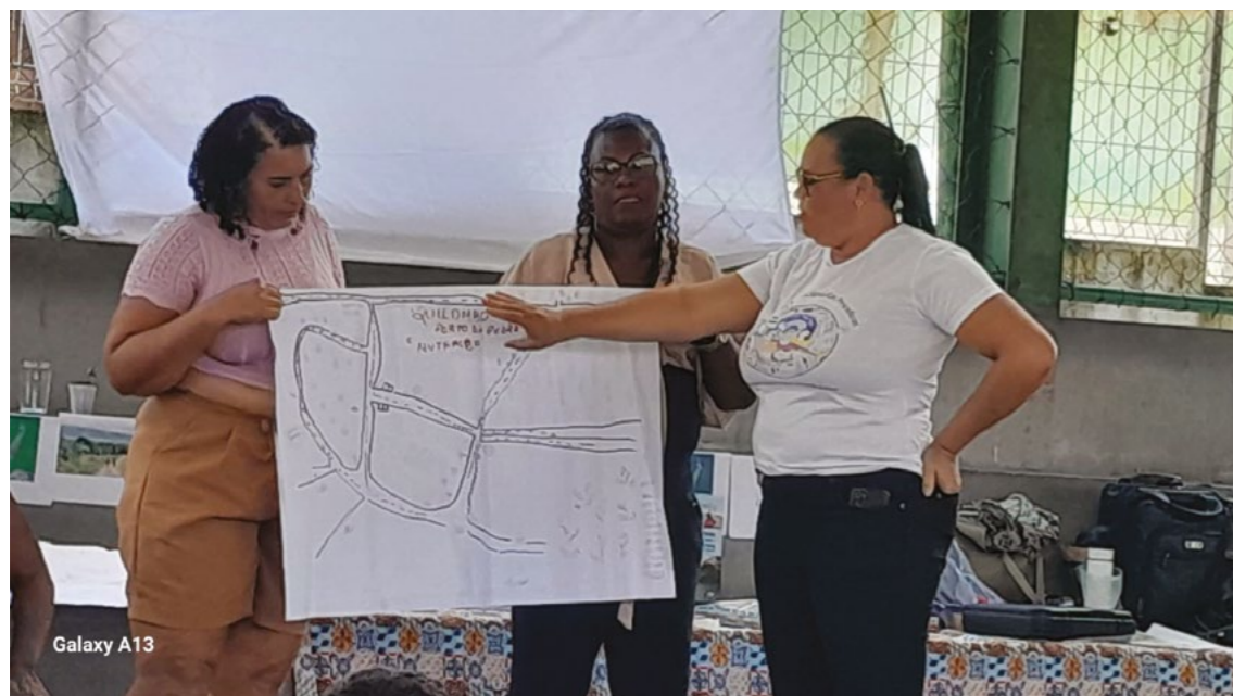
FIGURA 3: Oficina de Cartografia 2

“Antigamente, trabalhar nessas casas, morar no trabalho parecia bom, mas não era. A gente não ganhava praticamente nada. [...] Era em troca de comida, alguma roupa ou qualquer coisa assim [...]. Servia como escravo bom para os outros.”