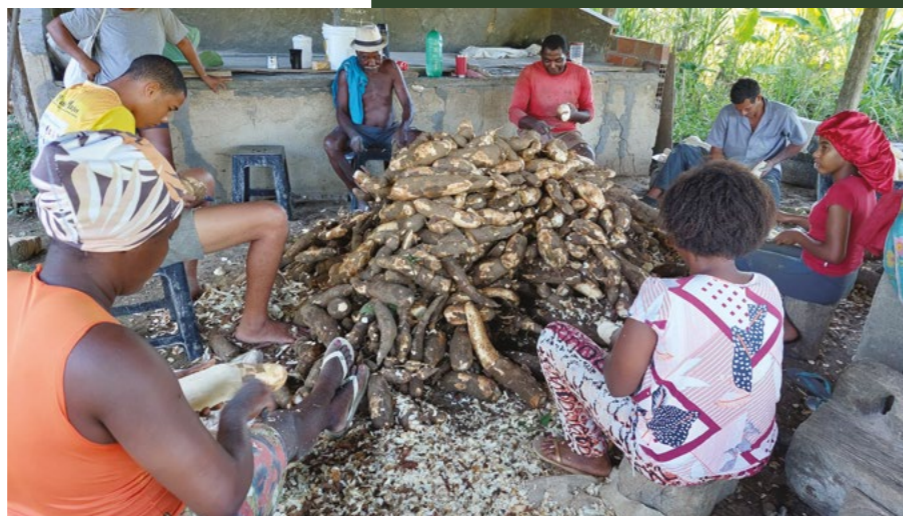
FIGURA 5: Casa de farinha de “Cara Gorda”, no Baixão do Guaí, Foram identificadas 41 casas de farinha ativas distribuídas em todo o território, 2026

“A gente gosta de manter os costumes que aprendemos vivendo e fazendo juntos com nossos parentes, vizinhos... Adjutório significa auxílio ajuda... Aqui nas comunidades Quilombolas só mudamos a pronúncia: digitório e digitoro que tem o mesmo sentido. Em nossa meninice e juventude onde quase o total das moradias eram construídas com barro, madeira e palha das matas, era nosso povo mesmo que ajudava os conterrâneos a Tapar e Cobrir casas, casas de farinha. Quando uma mulher paria seus filhos, as vizinhas iam cuidar para aquela mulher não ‘Quebrar o Resguardo’ num tempo que não tinha as facilidades de água na torneira e fogão a gás. Essas práticas de solidariedade existem até hoje; mesmo que de maneira diferente. Quando o pescador pega muito peixe, ele deixa na canoa e manda as pessoas irem buscar.