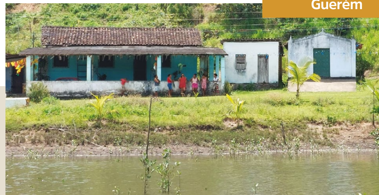
FIGURA 10: Sítio Cajazeiras (Guerém)

“O nome do lugar Guerém vem de um passarinho, um tipo de papagaio, ‘Guerrém’, e que talvez seja a linguagem dos mais velhos que ao invés de chamar ‘Guerrém’, começou a chamar Guerém.”