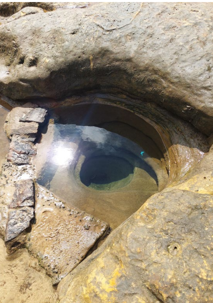
FIGURA 12: Olhos D'Água

“Sobre o olho d'água pra gente foi a salvação da gente no passado. [...] Às vezes, quando a maré estava cheia, as meninas iam levar os baldes e deixava lá pra quando a gente voltasse da maré [...]. Umam subiam andando e outras de canoa porque a canoa não dava pra todo mundo ir pra pegar água. Chegando no olho d'água, tinha muita fila de canoa. A gente chegava, mais não sabia quando saia de lá. Às vezes a maré enchia e a gente ficava sem água. Era muito peso e era muito difícil. Talvez por isso a gente esteja sofrendo muito com problemas no joelho e na coluna. O olho d'água abastecia toda região, inclusive a sede de Maragogipe. Eram muitas canoas, muitas embarcações, que eram abastecidas para que as pessoas levassem água para suas residências. Por isso era uma fila grande. Era água nos baldes, depois para as canoas que abastecia essas comunidades todas. A gente enchia os vasos e dava várias viagens até trazer água para todo mundo.”