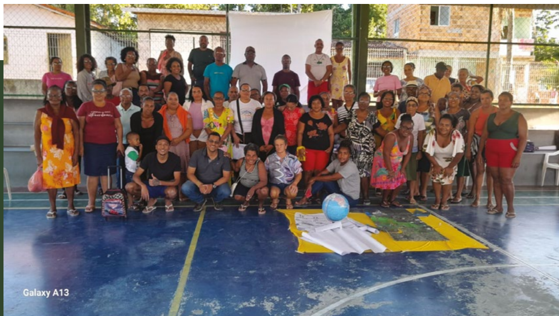
FIGURA 2: Oficina de Cartografia

“Eu acredito que esse instrumento, Protocolo de Consulta, é mais uma maneira da gente se defender do capitalismo que assola nossas comunidades. O próprio racismo institucional que a gente tem é muito forte. Então, é uma maneira de dizer: ‘a gente tá aqui, a gente vai lutar até o fim’.”